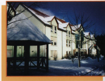
La Maison en hiver