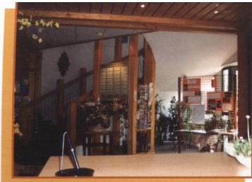
L'entrée de la Maison de Retraite