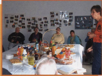
La journée du goût : les agrumes