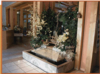
La décoration dans l'entrée