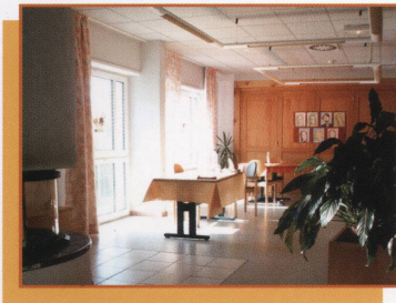
La salle à manger

Ce document vous est remis pour faciliter votre information et vous donner toutes précisions relatives à votre admission et à votre séjour.