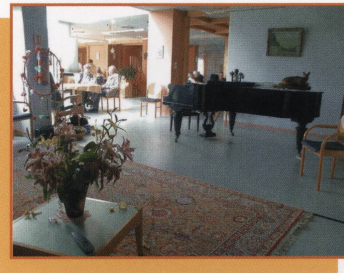
Le coin musique