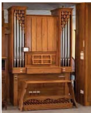
La chapelle de Bethlehem

* Coordonnées des aumôniers disponibles à l'accueil