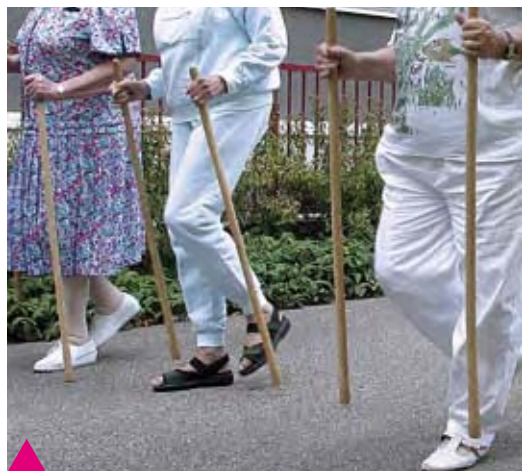
Maintenir une bonne motricité avec le Nordic walking dans les allées du parc...

Il prend en compte les besoins et les attentes du résident, ses capacités physiques et cognitives, tout en respectant ses habitudes et préférences.