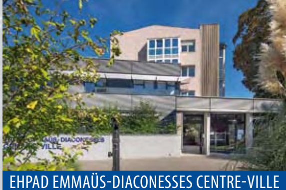
EHPAD EMMAÜS-DIACONESSES CENTRE-VILLE

3 rue Sainte-Élisabeth 67000 Strasbourg Tél. 03 88 14 42 95 Fax 03 88 14 42 96 Courriel : ecv@diaconesses.fr Site internet : www.diaconesses.fr Consulter également le site : www.alliance-st-thomas-seniors.fr