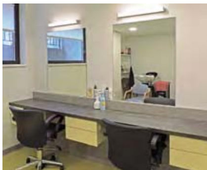
Salon de coiffure de l'EHPAD

Ces différentes prestations ne donnent pas lieu à une facturation par l'établissement et sont à régler directement au prestataire.