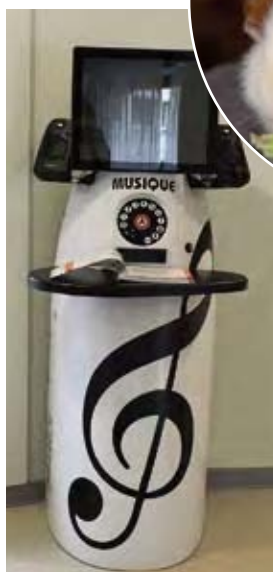
(de gauche à droite) Spectacle comique Borne mélo Médiation animale