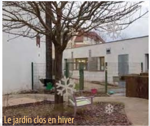
Le jardin clos en hiver