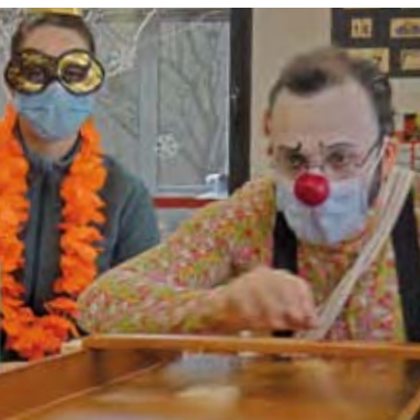
Intervention de l'association « Cœur de Clowns »