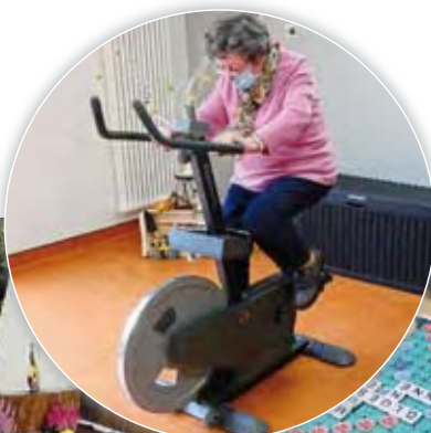
Atelier vélo et gymnastique douce

Tous les repas sont pris avec le personnel, dans une ambiance chaleureuse. Une aide au repas peut être apportée, si nécessaire.