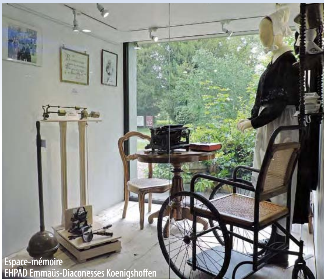
Espace-mémoire EHPAD Emmaüs-Diaconesses Koenigshoffen