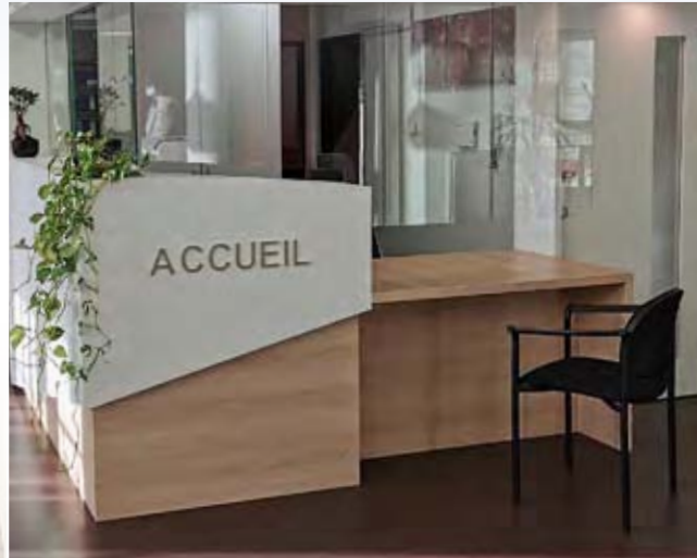
L'accueil principal de l'EHPAD Les Quatre Vents

Pour assurer un accueil de qualité et veiller à la cohésion du groupe, il est important de respecter les horaires et d'informer l'Accueil de Jour de tout désistement à une venue programmée ou de tout retard éventuel ou absence inopinée par téléphone au 03 88 64 78 00 .