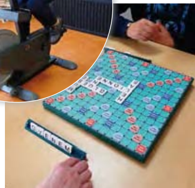
Jeu de société