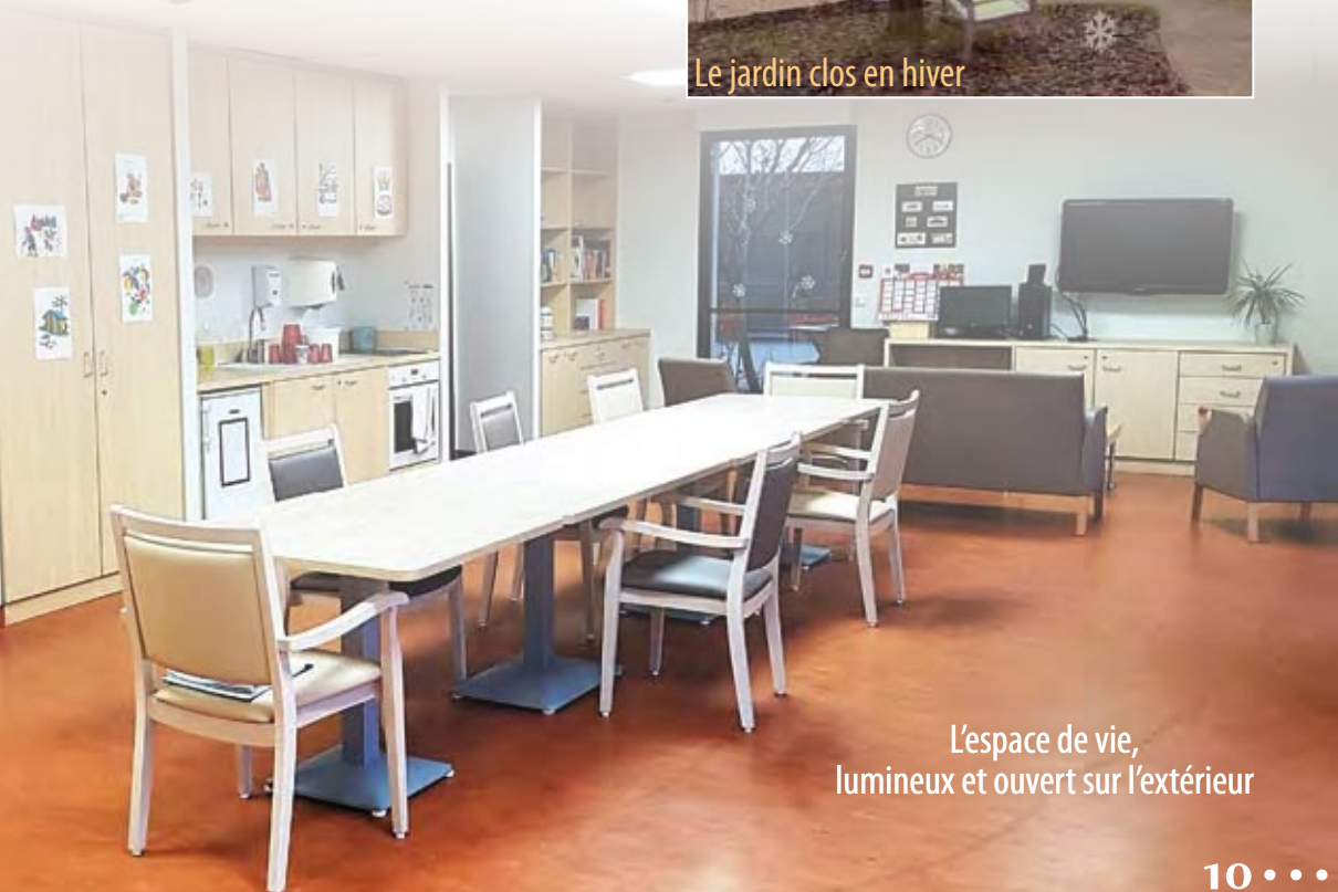
L'espace de vie, lumineux et ouvert sur l'extérieur